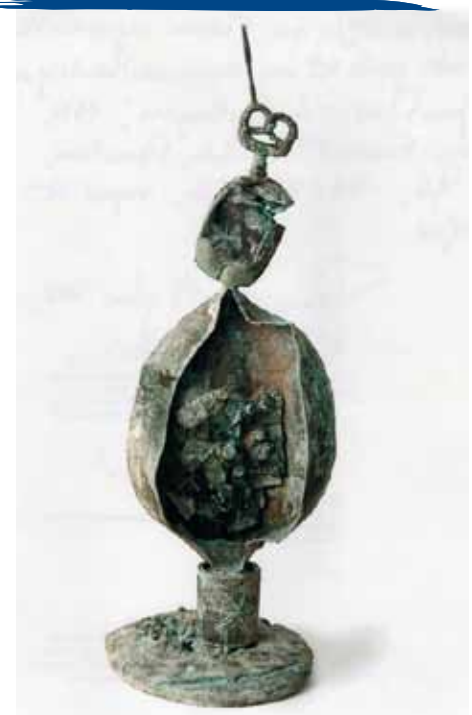
'La Boulangère' de Joan Miró

cuentra en la calle Baixamar 56, que se adecuará para albergar las obras. Además, la exposición permanente se complementará con muestras temporales de obras procedentes de colecciones particulares, y contará con una programación estable de charlas y talleres. Todo ello permitirá que este sea un espacio vivo y dinámico, y un punto de encuentro ineludible para los amantes del arte y la cultura, resultando un importante polo de atracción de visitantes que contribuirá significativamente a la dinamización del sector comercial y de la restauración.